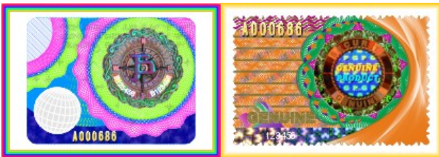
今達有限公司 印刷服務展區 展位: 3-B20