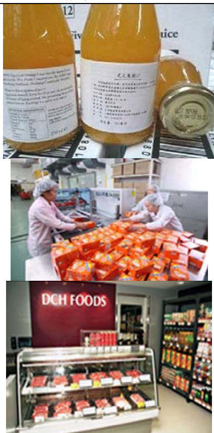
大昌行物流有限公司 綜合包裝方案展區(新展區) 展位: 3-F17