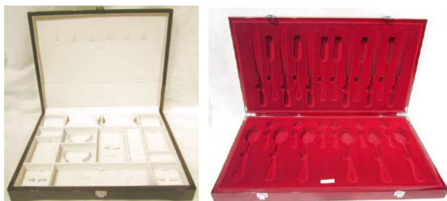
恒利包裝製品有限公司 高級包裝及印刷專區 (新展區) 展位: 3-F04