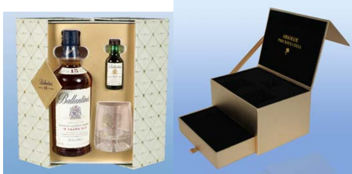
上海憬之禮品包裝有限公司 高級包裝及印刷專區 (新展區) 展位: 3-F02