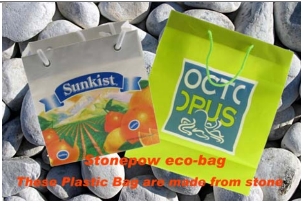
振興展業有限公司 包裝服務展區 展位: 3-E04