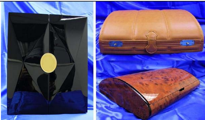
瑞康實業有限公司 高級包裝及印刷專區 (新展區) 展位: 3-F01