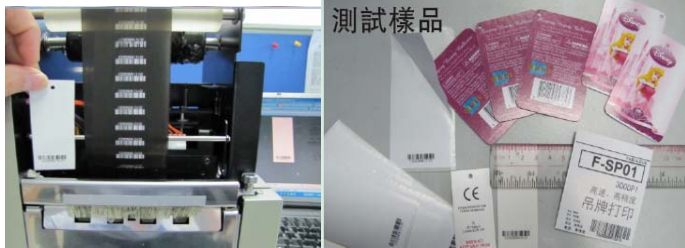
豐佳卓裕資訊設備有限公司 數碼印刷設備展區 展位: 6-B12