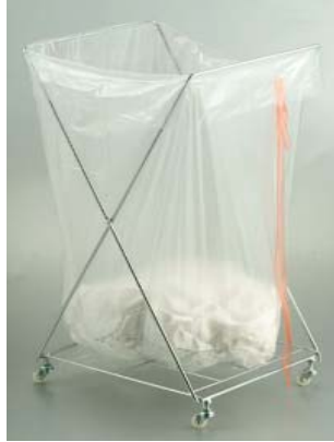
永駒有限公司 包裝服務展區 展位: 3-E09