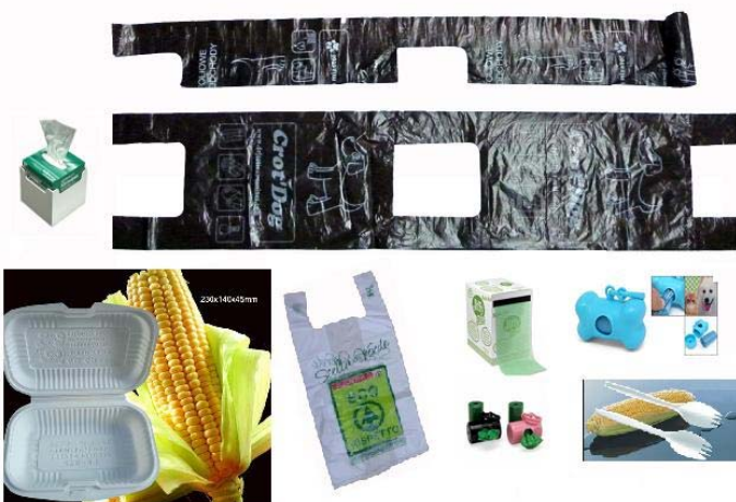
日豐塑膠彩印包裝(香港)有限公司 包裝服務展區 展位: 3-E01