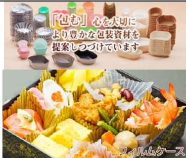
Shinmei Co., Ltd 食品及飲料包裝方案展區 展位: 3-J26