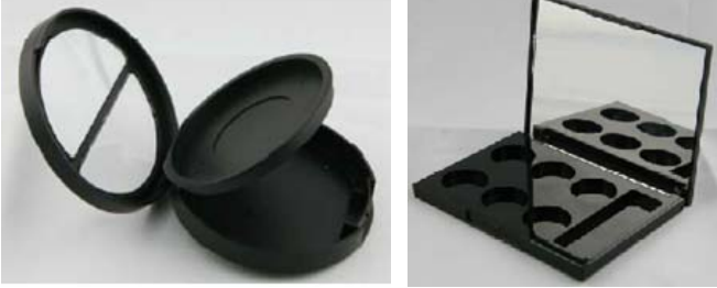
濠福有限公司 高級包裝及印刷專區 (新展區) 展位: 3-F03