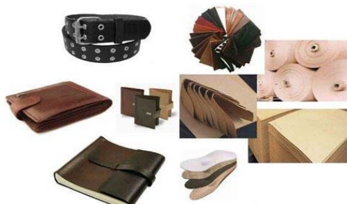
唐朝物料有限公司 印刷耗材及包裝材料展區 展位:6-E01