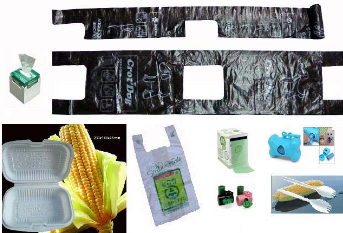
日丰塑料彩印包装(香港)有限公司 包装服务展区 展位: 3-E01