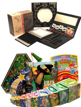
中大印刷(中国)有限公司 印刷服务展区 展位: 3-B07