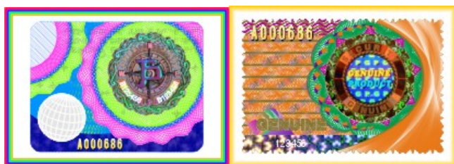
今达有限公司 印刷服务展区 展位: 3-B20