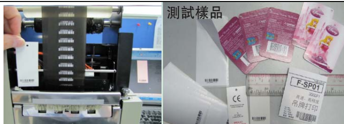
丰佳卓裕信息设备有限公司 数码印刷设备展区 展位: 6-B12