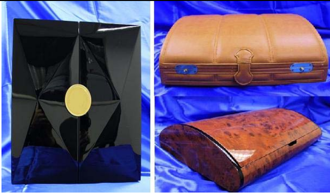
瑞康实业有限公司 高级包装及印刷专区 (新展区) 展位: 3-F01