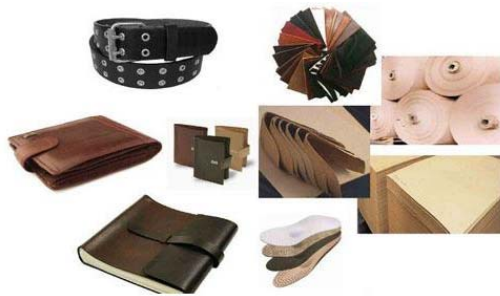
唐朝物料有限公司 印刷耗材及包装材料展区 展位:6-E01