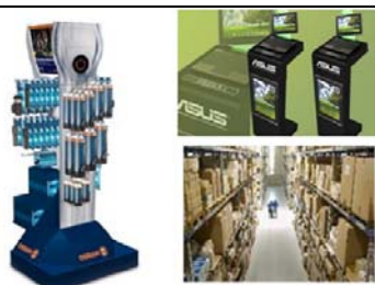
STI Asia Pacific Limited 包装服务展区 展位: 3-E16; 3-E18