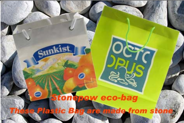
振兴展业有限公司 包装服务展区 展位: 3-E04